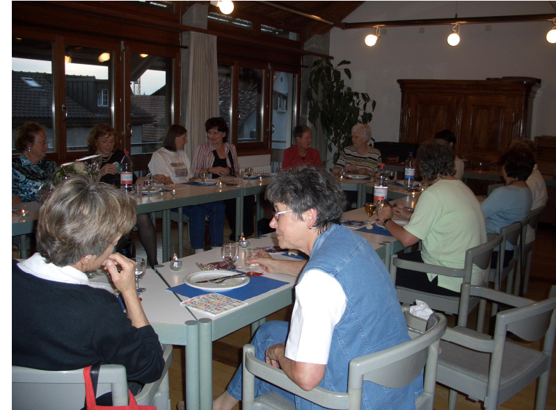
Generalversammlung in der Chilestube