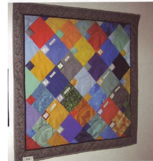
Id av Elisabeth Nyfeiler