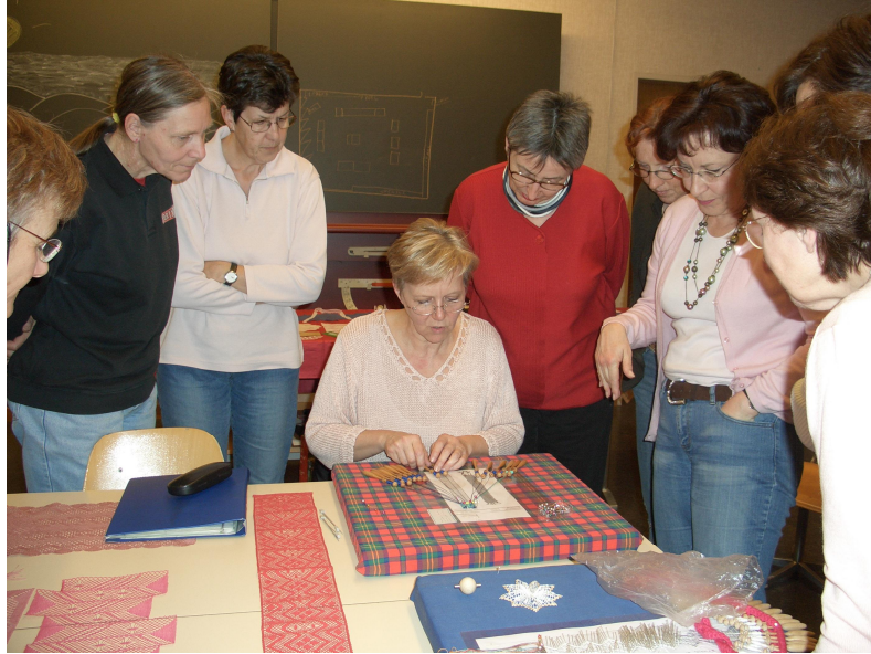
Auch Klöppeln ist spannend!