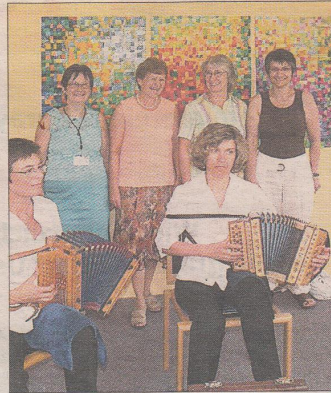
Stolz präsentieren die Kreativen der Quiltgruppe den gefertigten Quilt für das Alters- und Pflegeheim (ü).