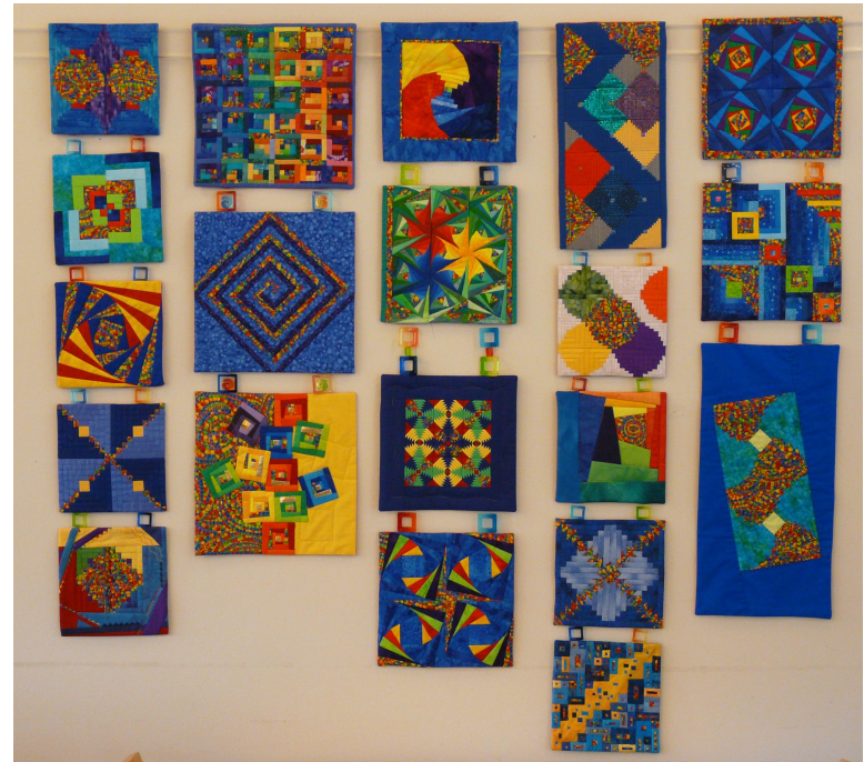
„Tango furioso“, unser Geschenk ans Alterszentrum Bussnang