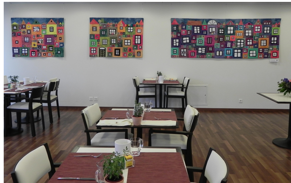
„En Fäischerplatz“, der dreiteilige Quilt, den wir dem Wiesliacher geschenkt haben.