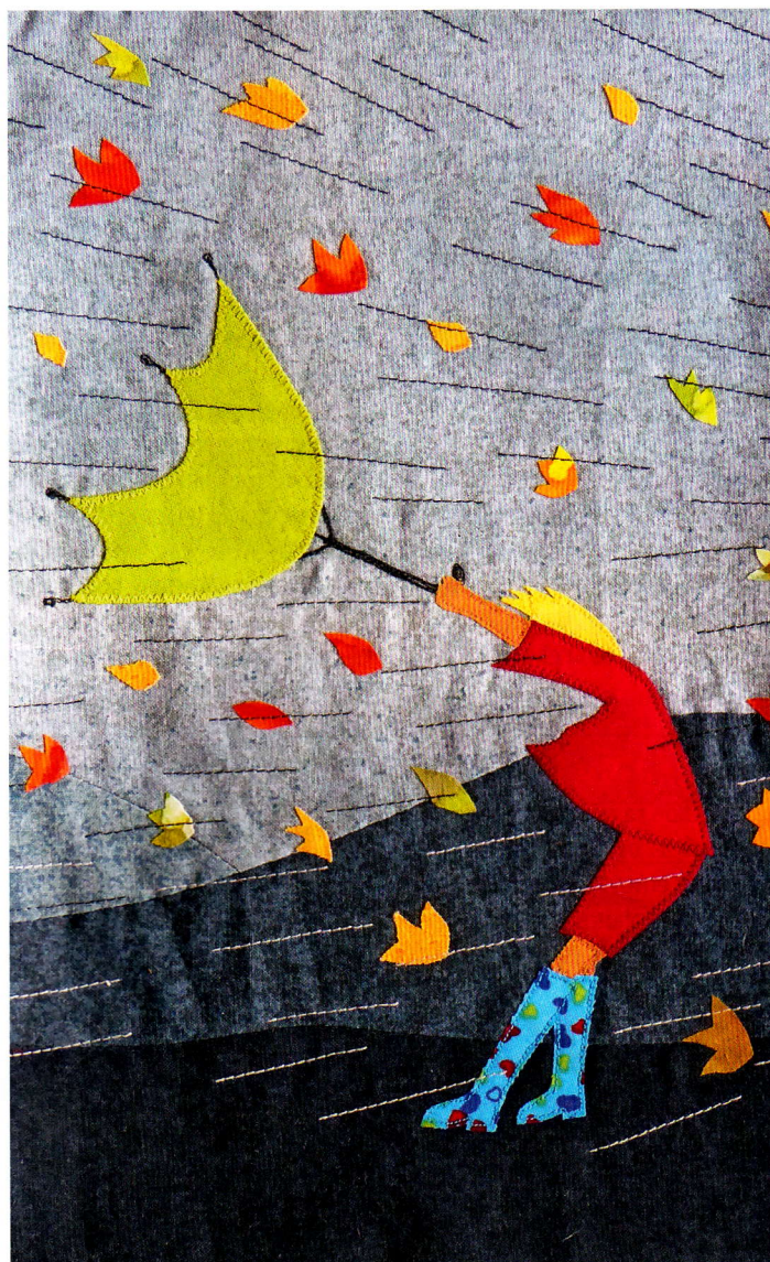
Tempête de Trudi Mettler